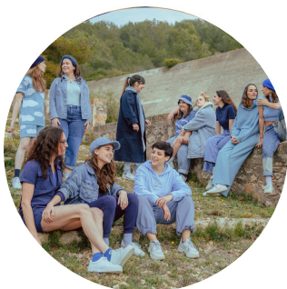
BALKAN PARADISE ORCHESTRA

Todo ello desde la perspectiva de la pedagogía Orff-Schulwerk y la didáctica de grupo.